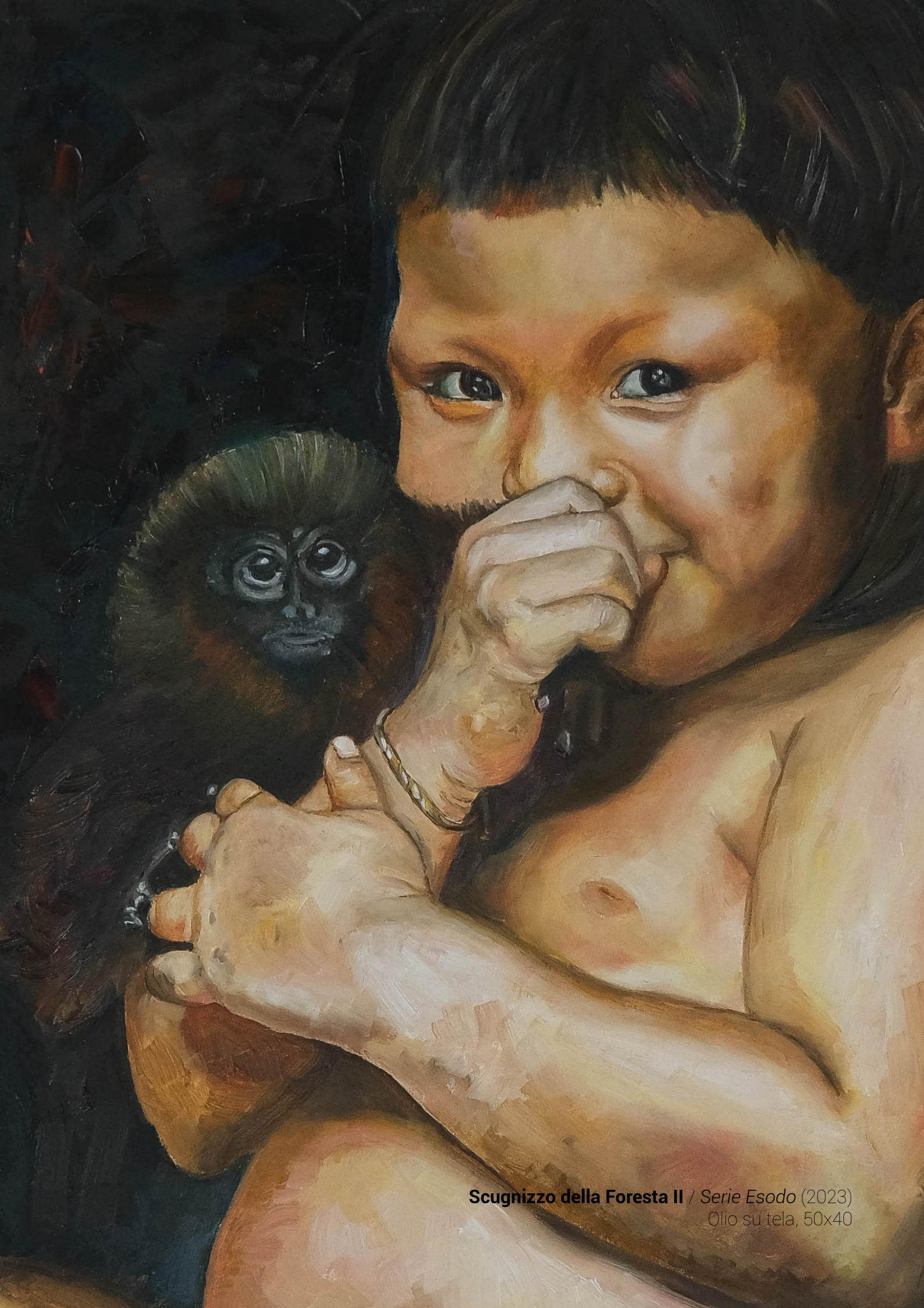
Scugnizzo della Foresta II / Serie Esodo (2023) Olio su tela, 50x40