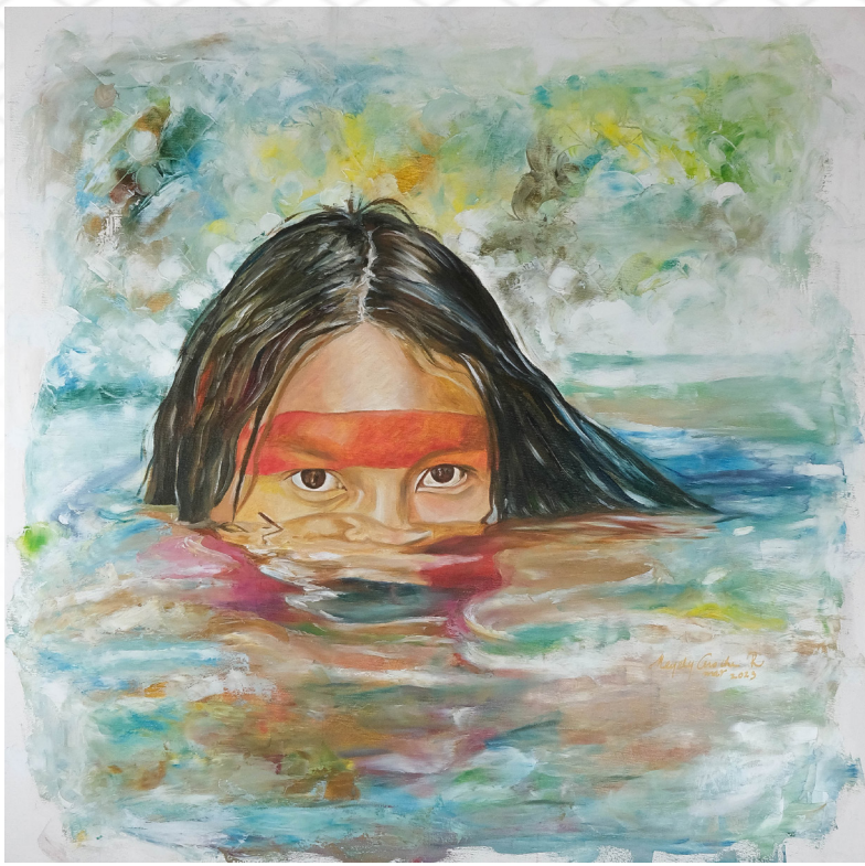
Rojo (2023) Olio, gesso e acrilico su tela, 80x80