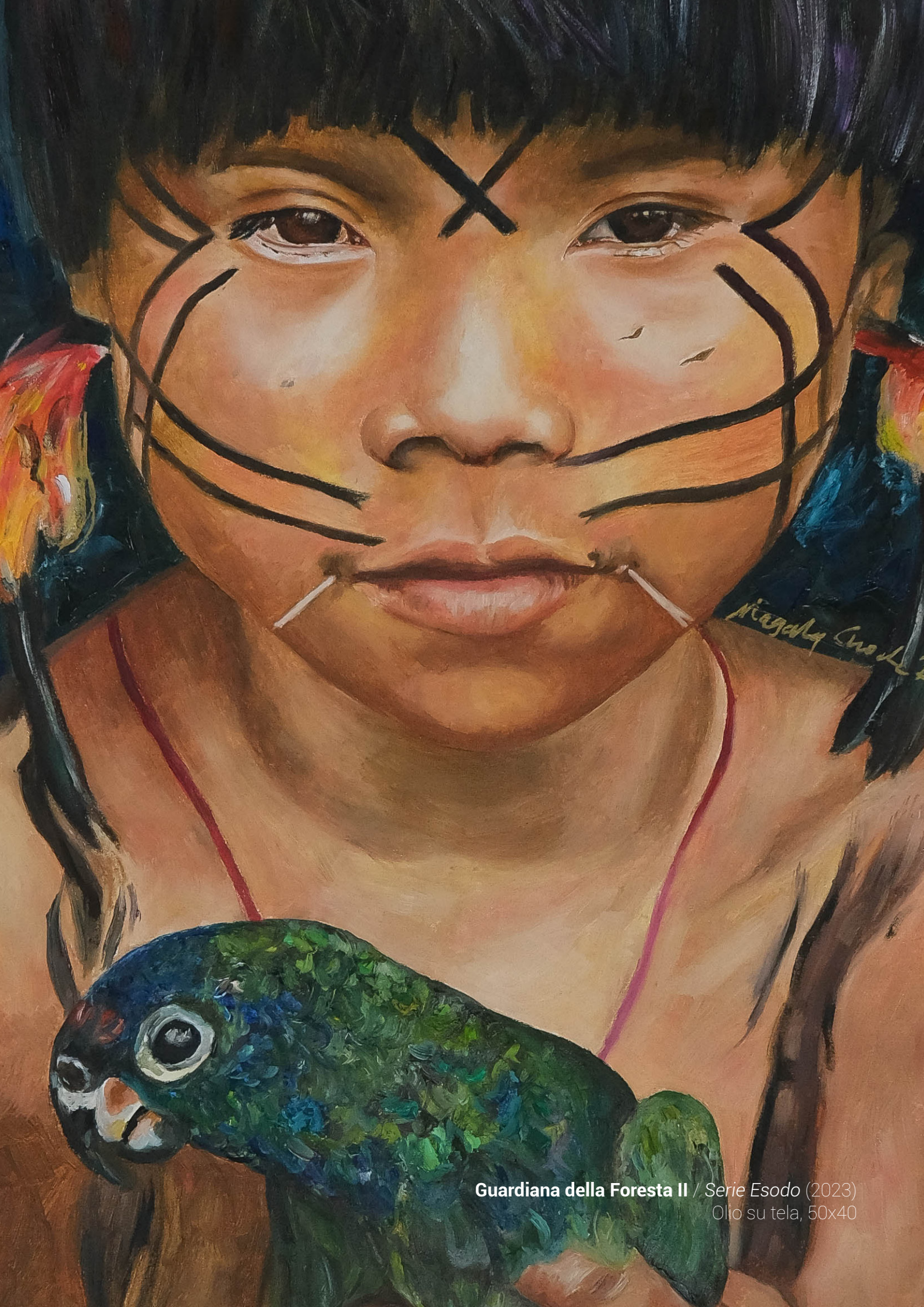
Guardiana della Foresta II / Serie Esodo (2023) Olio su tela, 50x40