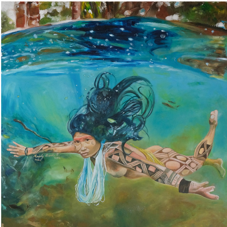
Acqua (2022) Olio su tela, 80x80

La tribù Yanomami vive nelle foreste pluviali e sui monti al confine tra il Brasile settentrionale e il Venezuela meridionale e custodisce una cultura millenaria che andrebbe tutelata. Tale popolazione, però, è costretta a opporsi – seppur pacificamente – all'attività mineraria operata nelle loro terre dai garimpeiros , i cercatori d'oro. Rojo raffigura una donna indigena immersa nell'elemento acqua, fondamentale per la vita di tutti, ancor più essenziale per chi vive di pesca come queste popolazioni. Lo sguardo esprime forza anche in una situazione in cui la sopravvivenza è compromessa. Il colore rosso, che dà il titolo all'opera, spicca fra gli altri, sapientemente sfumati e, nonostante sia per il popolo Yanomami il colore della festa, in questa occasione allude alla violenza e alla pericolosità delle acque inquinate a causa del mercurio, utilizzato illegalmente per la ricerca dell'oro.